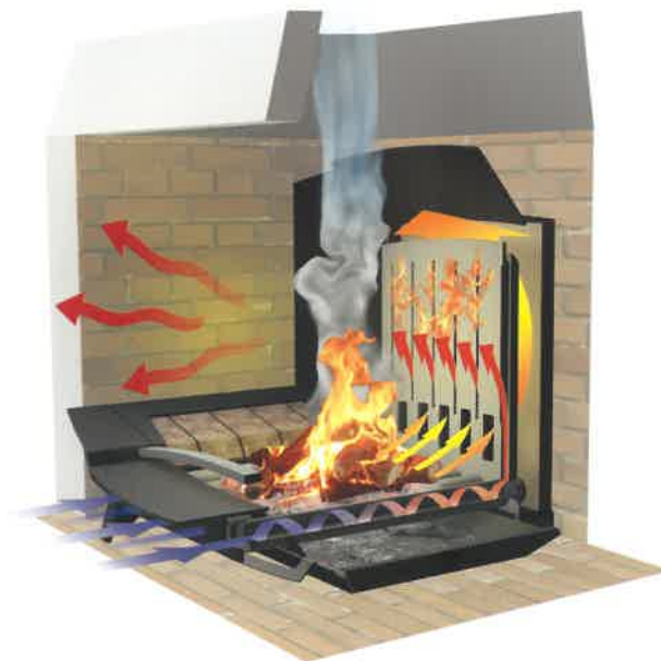
Technologie | DCMO